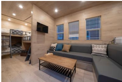
グランピングキャビン

三密回避の里山リゾートへの直行ヘリ送迎付きプラン。東京からたったの30分で到着する本格フィンランドコテージでのおこもりステイ。1棟貸しのプライベートステイで誰にも会わない空間をお楽しみいただけます。本プラン限定特典として、「ワインアワー」や「焚き火ナイト」等、全てのアクティビティを無料で提供します。1泊2名様：65,000円（税込）から。