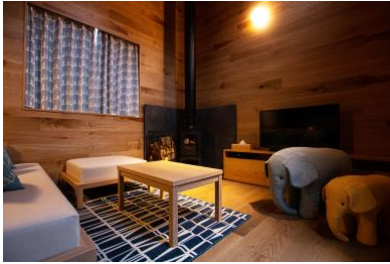
サウナスイートキャビン