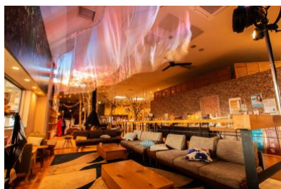
おふろ café utatane ラウンジ

新型コロナウイルスの流行が続き、これまで定番であった海外への卒業旅行や長期間の外出がしにくい状況下、「それでも一生に一度の一時を大切にお過ごしいただきたい」という思いから、埼玉県の3つの宿泊施設にて「近場で海外気分を味わえる宿泊体験」と「安心安全なご滞在」をお楽しみいただける卒業旅行プランの販売を開始いたします。