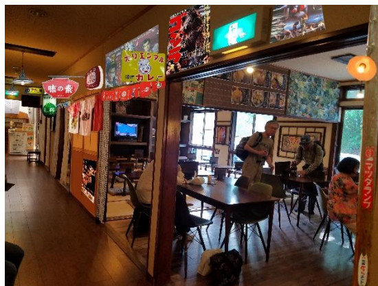
画像はイメージです。

私ども株式会社温泉道場が本社を置く「昭和レトロな温泉銭湯 玉川温泉」(埼玉県ときがわ町)は、7月15日、さらにお客様に楽しんでいただける施設を目指しリニューアルオープンします。